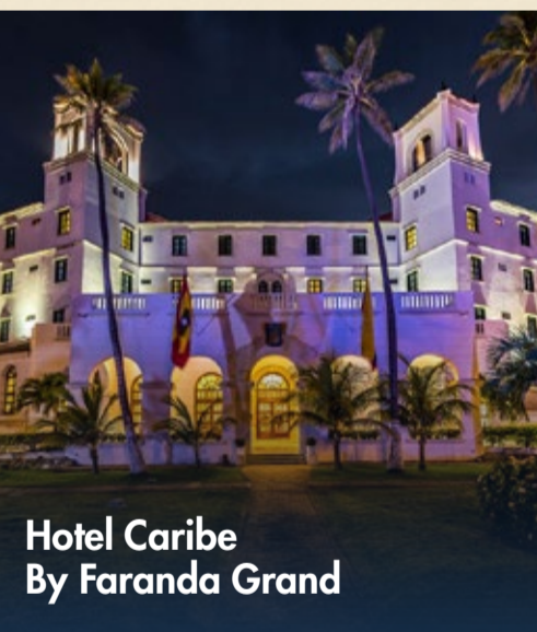
Hotel Caribe By Faranda Grand