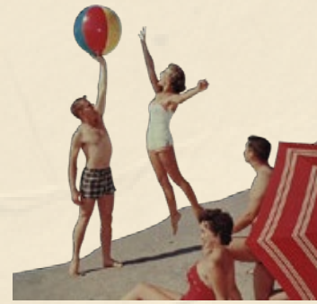
Club de playa