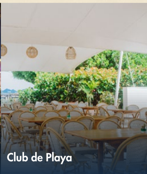
Club de Playa