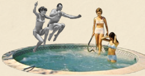
Acceso a zonas húmedas